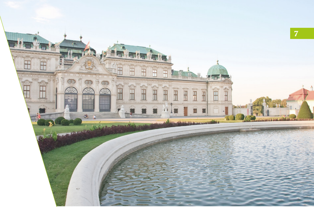
Im prachtvollen Barockschloss Belvedere kann man auch eine der wertvollsten Kunstsammlungen Österreichs besichtigen.